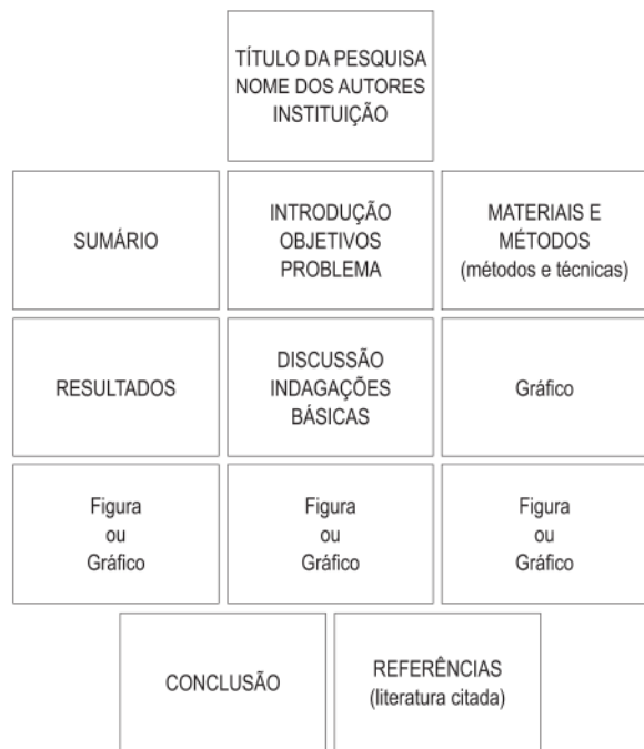
Figura 1 – Painel artesanal (1 m 2 ).

Se houver alguma dúvida sobre a ordem em que o texto deve ser lido, guie o leitor, numerando o texto claramente ou ligando-o com setas. O fluxo da informação deverá ser lido seguindo a seqüência da esquerda para a direita e do alto para baixo 1 .